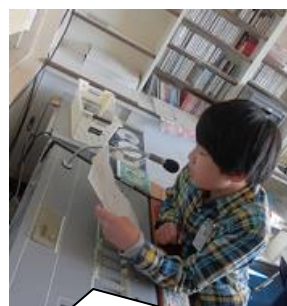
「インフルエンザ予防のために、手洗い・うがいをていねいにしましょう。」 (児童保健委員会から放送)