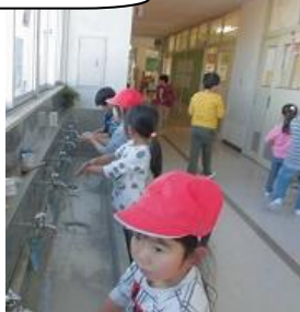
お水はつめたいけど がんばって洗います (1年生)